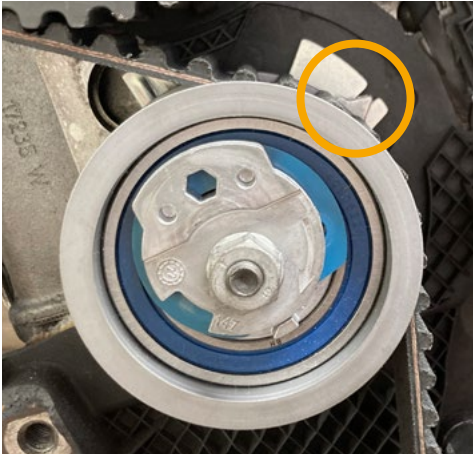
Şekil 1 Varyant 1

Teslimat kapsamındaki V55739 gergi rulmanı, araç içine monte edilmiş olan gergi kasnağından farklı görsel özelliklere sahip olabilir. İki farklı versiyonu bulunmaktadır: